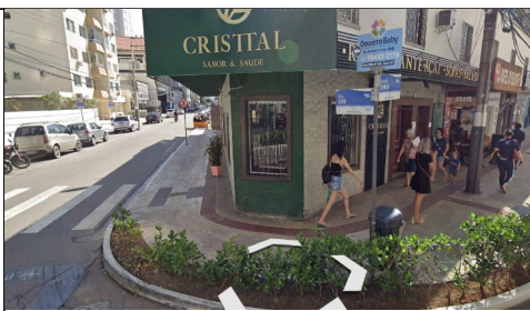
Imagem 03 - Foto do local (Google Earth, 01/2022)